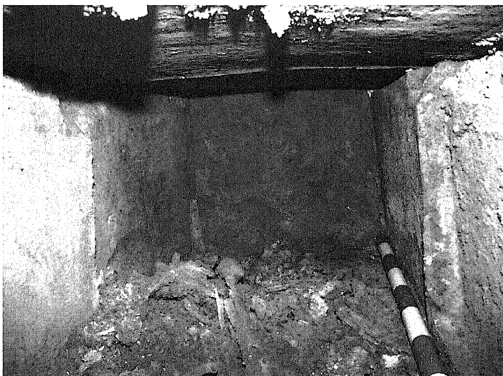
Interior de la Tumba II en el momento de su apertura.