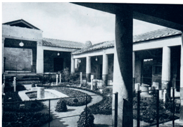
Pompeya. Peristilo con oscilla suspendidos (Reg. VI, Ins. 17) Pompeji 1973, 85