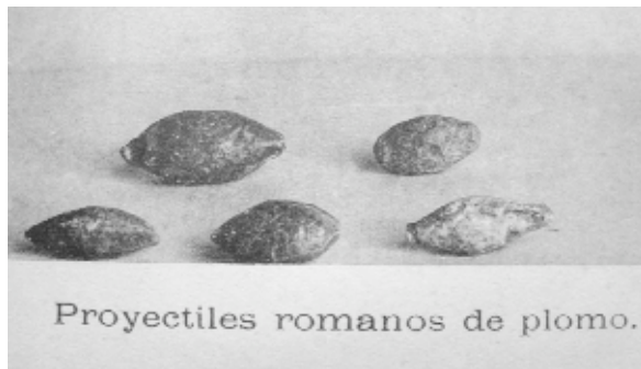
Figura 2a. Grupo de cinco glandes “romanas” encontradas en Numancia entre 1906 y 1912, según Taracena AA.VV. 1912, Excavaciones en Numancia 1912, p. 47 y lám. 49; marcada con un círculo, [cat. 2].

Glande de forma almendrada y quizá con restos de la rebaba por mal ajuste del molde. Medía 33 mm de largo, con diámetro medio de 16,5 mm; peso: 47 gr. Letras de 5 mm en un sólo renglón, leídas por los primeros editores como ΑΙΠΩ (fig. 2 A y B)