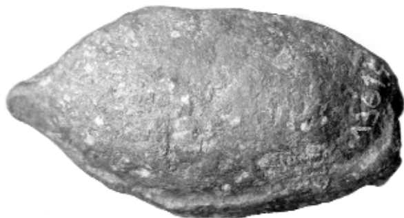
Figura 4. Glande del Museo Numantino de Soria, inv. 13614 [cat. 4].

que en otras balas, posiblemente porque no se desprendió bien el metal de la vena del molde. La superficie presenta muchas concreciones que ocultan parcialmente la inscripción. Mide 35 mm de longitud y sus diámetros, 18 y 15 mm. Pesa 49,7 gr. Como en los casos anteriores, el rótulo está dispuesto en dos líneas con letras de 5 mm (fig. 4).