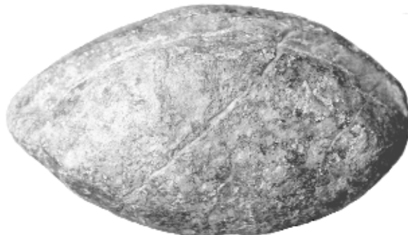
Figura 2b. Glande del Museo Numantino de Soria, inv. 13610 [cat. 2].

AA.VV. 1912, Excavaciones de Numancia , p. 47 y lám 49.