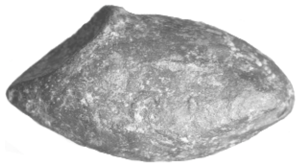
Figura 3. Glande del Museo Numantino de Soria, inv. 13612 [cat. 3].

Glande de forma almendrada y sección circular ligeramente aplastada. La rebaba longitudinal producida por el mal ajuste del molde y tan característica de estos proyectiles aparece en éste muy poco marcada, quizá porque fue cortada o martillada tras retirarla del molde; en cambio, el pico izquierdo es más alargado