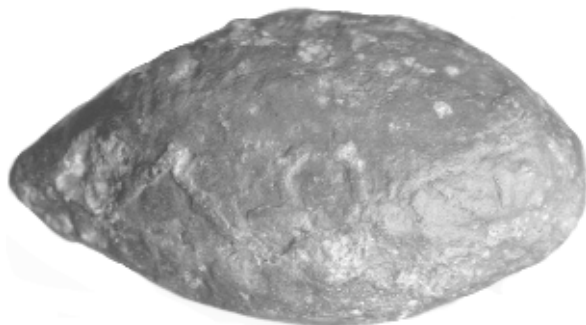
Figura 5. Glande del Museo Numantino de Soria, inv. 13617 [cat. 5].