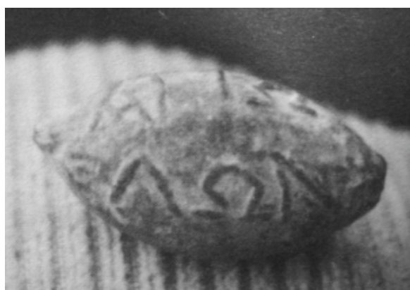
Figura 6. Una de las cuatro glandes similares que pertenecen a una colección particular de Sevilla y que se dicen encontradas en algún punto “al sur de Numancia” [cat. 6], según González 1996, “P. Cornelius Scipio Aemilianus et Aetoli”, p. 143.

[6] Una glande perteneciente a una colección particular de Sevilla. Descrita como de “forma ovalada, con la peculiaridad de que no presenta línea de sutura entres sus dos mitades” 19 ; mide 18 x 32 x 15 mm. Letras distribuidas en dos líneas, miden 5 mm y su relieve es muy nítido. Según la información proporcionada al editor, fue “encontrada en uno de los antiguos campamentos al sur de las ruínas de Numancia”, lo que le hace suponer que procede del de Peña Redonda, La Rasa o La Dehesilla (fig. 6)